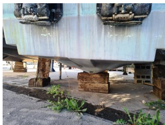
6. Krma brodice – nema vidljivih pukotina