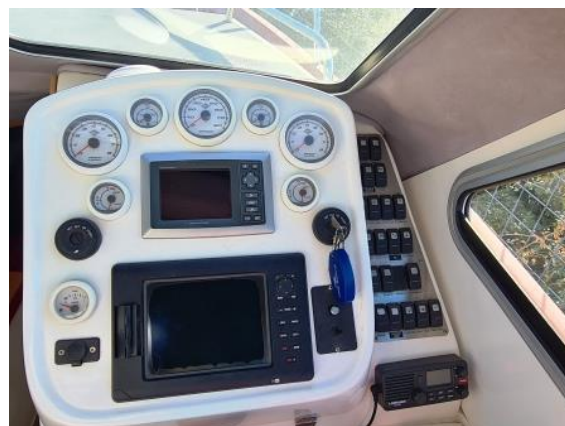
26. Upravljačka konzola sa uređajima za navigaciju