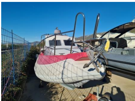
3. Pogled sa pramca