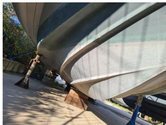
4. Dno brodice - OK