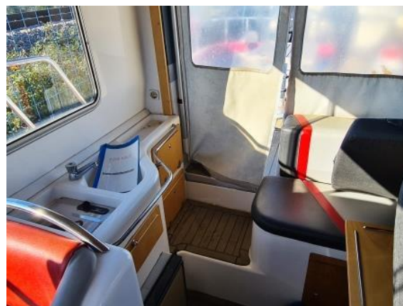
22. Interijer – stanje zapušteno