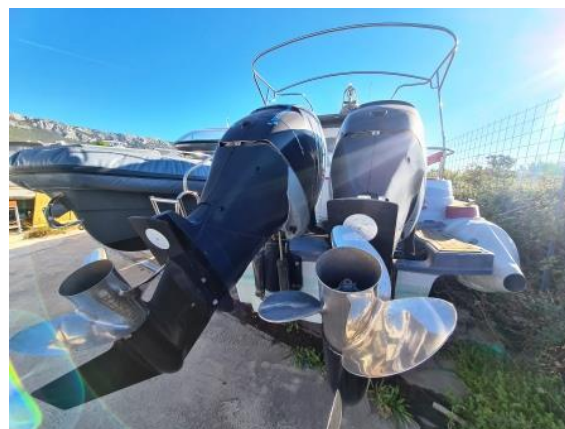
32. Brodski vijci - OK