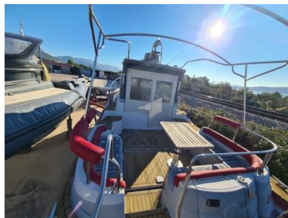
10. Pogled sa krme