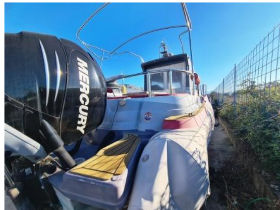
8. Pogled desne strane – ispuhani tubovi