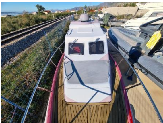
13. Pogled na kabinu – visok utjecaj vremenaliija