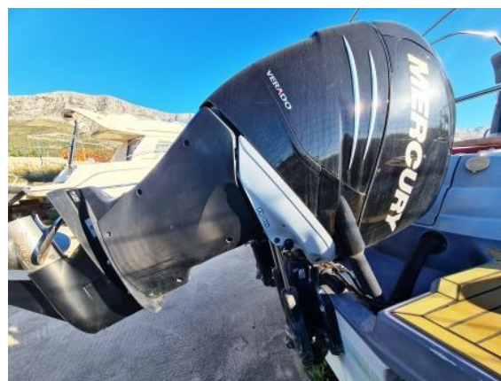
36. Porivni uređaj – pogled sa boka