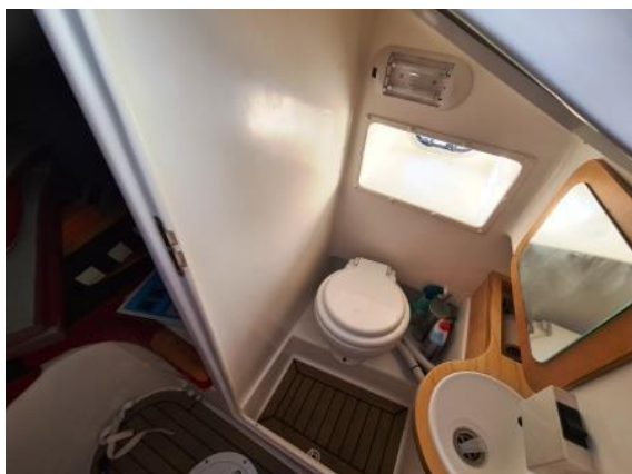
25. Sanitarni čvor