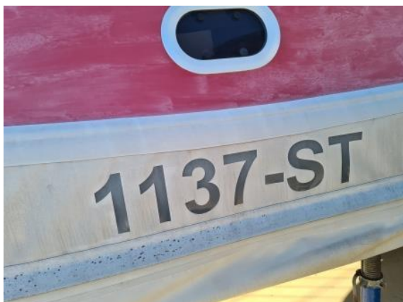
1. Reg. broj