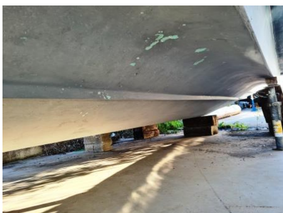
5. Dno brodice - OK