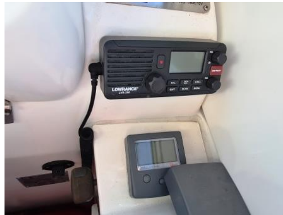
28. VHF i brojač lanca