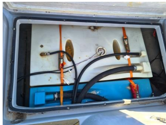
16. Tankovi vode i goriva – nisu ispitani