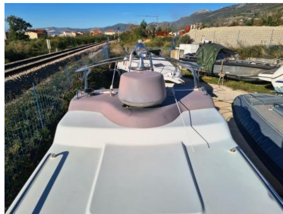
14. Antene – visok utjecaj vremenaliija