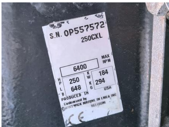
33. Lijevi motor – identifikacijska naljepnica