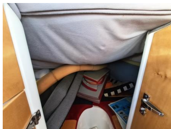
24. Obloga stropa kabine – potrebna obnova