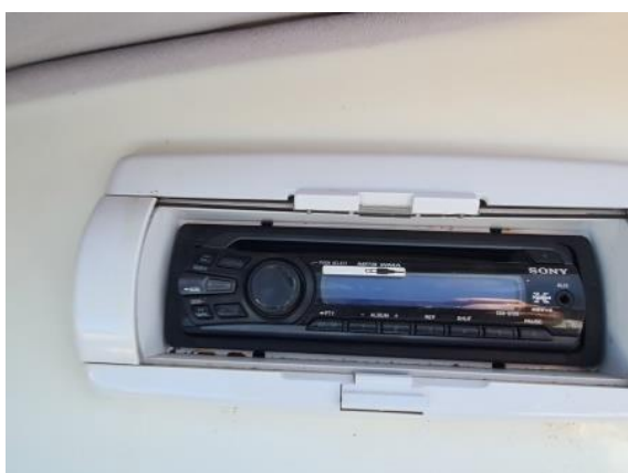
29. Radio – CD uređaj