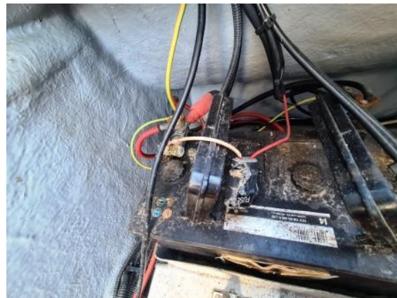
20. Osigurač - istopljen