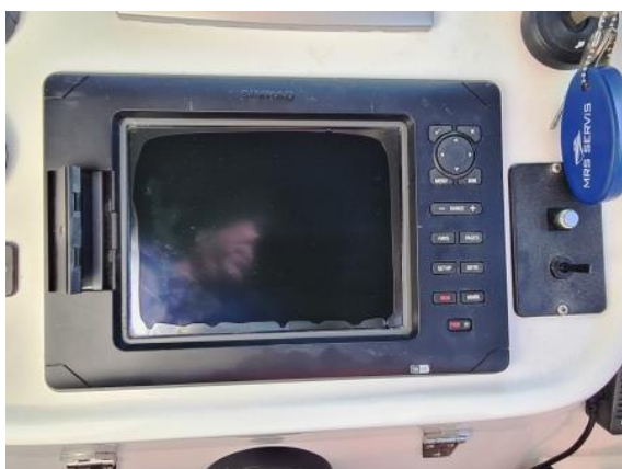
27. GPS ploter – visok utjecaj vremenalija