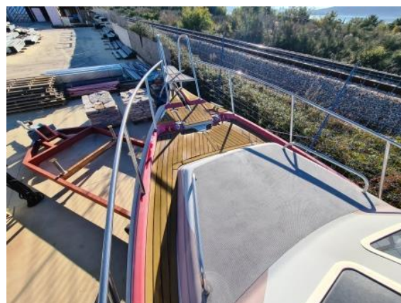
12. Pramac – umjetna obloga