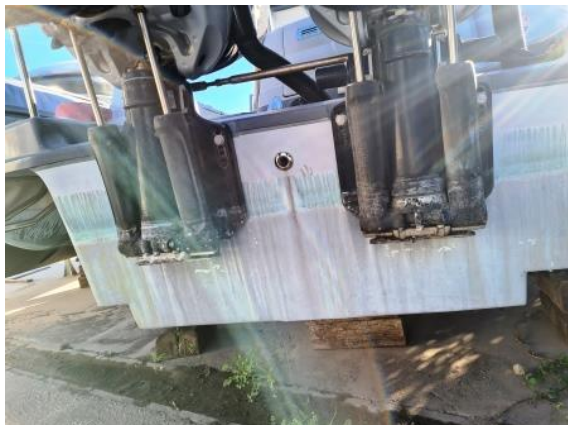
7. Motori postavljeni na zrcalo