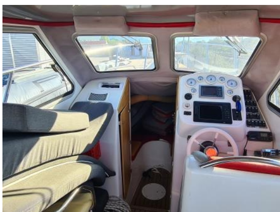
21. Unutrašnjost brodice – zapušteno