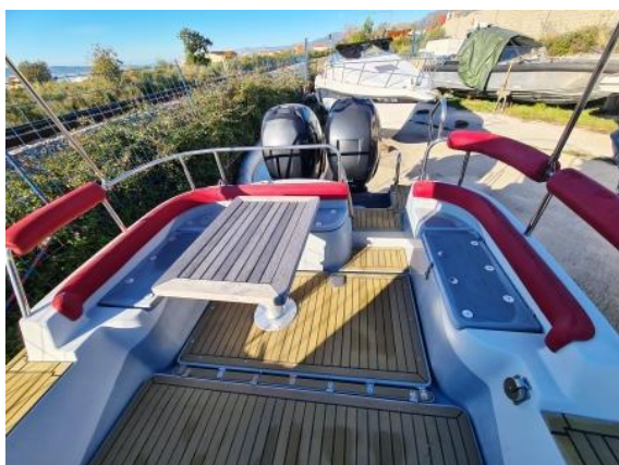
11. Stol izrađen iz Tika – potrebno obnoviti