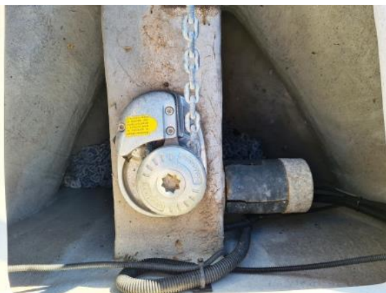
15. Sidreno vitlo – potrebno servisiranje