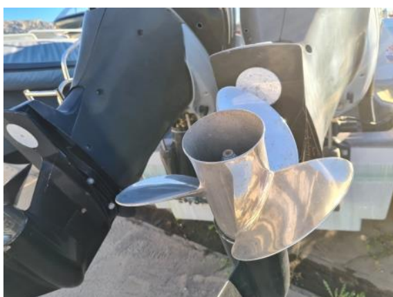
35. Brodski vijci - OK