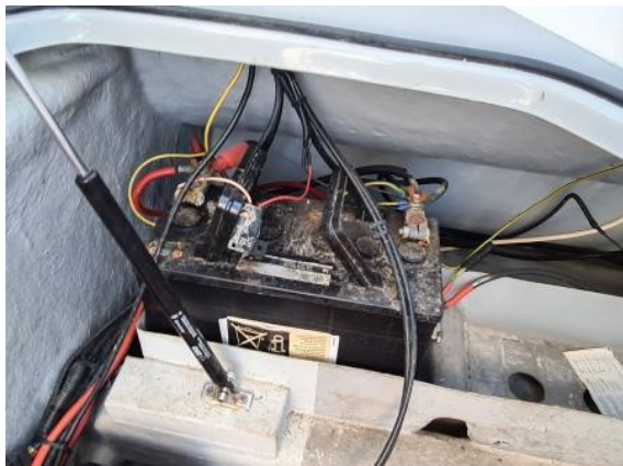
19. Motorna baterija – neispravna i oksidirana