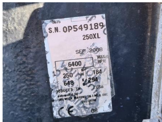
34. Desni motor – identifikacijska naljepnica