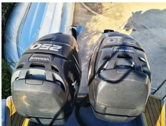
31. Pogonski motori