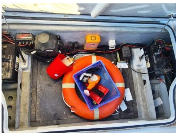
17. Prostor el. instalacija