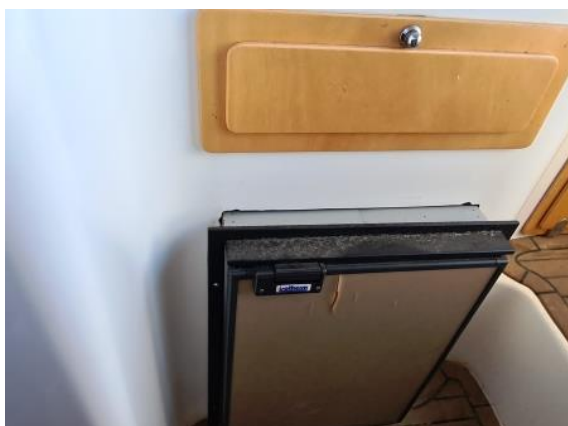
23. Hladnjak – oštećena vratnica