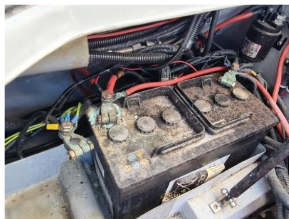
18. Motorna baterija – neispravna i oksidirana