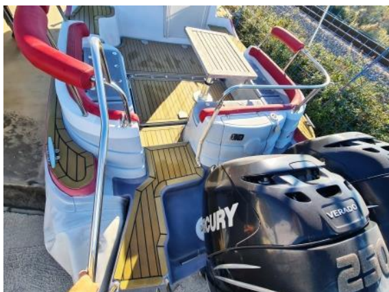
9. Pogled u kokpit – umjetna tikovina